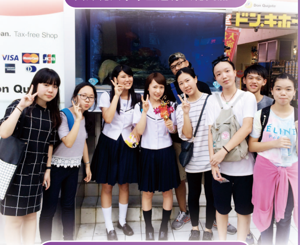
在沖繩國際通與當地居民交換紀念品