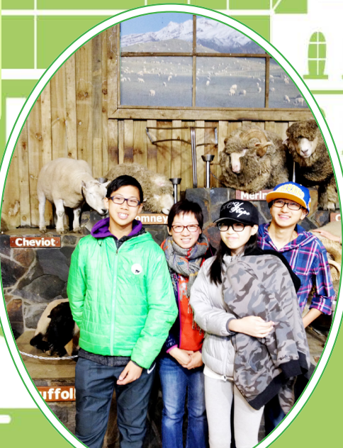
The students on a sheep farm.