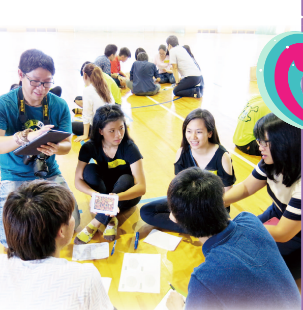
與沖繩大學學生進行文化交流