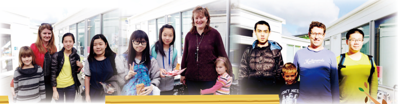
Our students' first meeting with their homestay families.