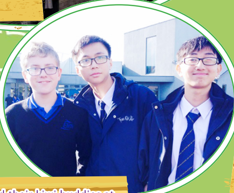
Our students and their kiwi buddies at Elim Christian College.