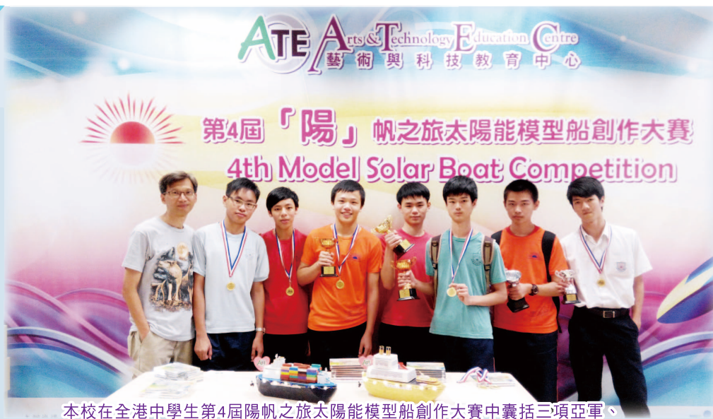
本校在全港中學生第4屆帆之旅太陽能模型船創作大賽中囊括三項亞軍、一項季軍及三項優異獎，滿載而歸。