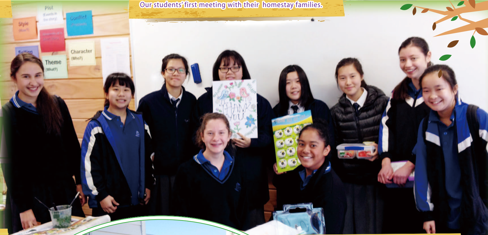
Our students and buddies exchanging cards on their last school day.