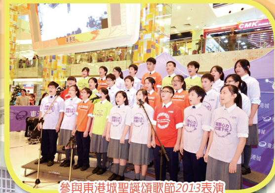
參與東港城聖誕頌歌節2013表演