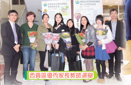
西貢區優秀家長教師選舉