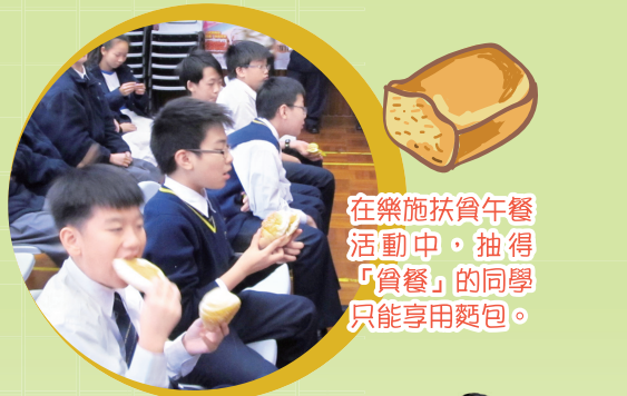
在樂施扶貧午餐活動中，抽得「貧餐」的同學只能享用麪包。