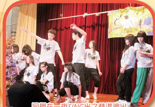
同學在一夜SING光之精湛演出