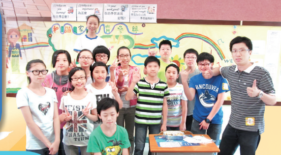
齊來響應公益金便服日