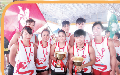
本校龍舟隊在澳門國際龍舟邀請賽中獲得國際公開組500米乙組亞軍及國際女子組500米乙組冠軍