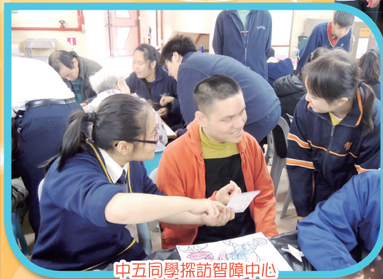
中五同學探訪智障中心