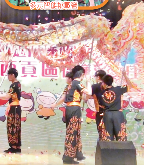
龍獅藝隊獲邀出席表演