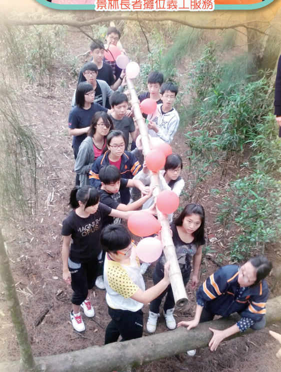
工作實習計劃訓練營