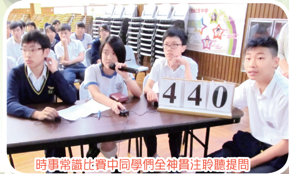
時事常識比賽中同學們全神貫注聆聽提問