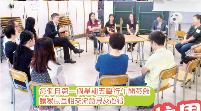
每個月第一個星期五舉行午間茶敘 讓家長互相交流意見及心得