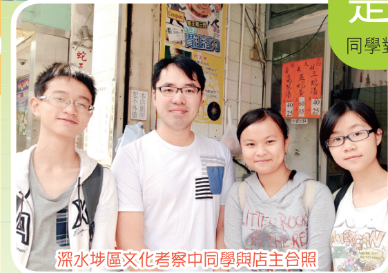
深水埗區文化考察中同學與店主合照