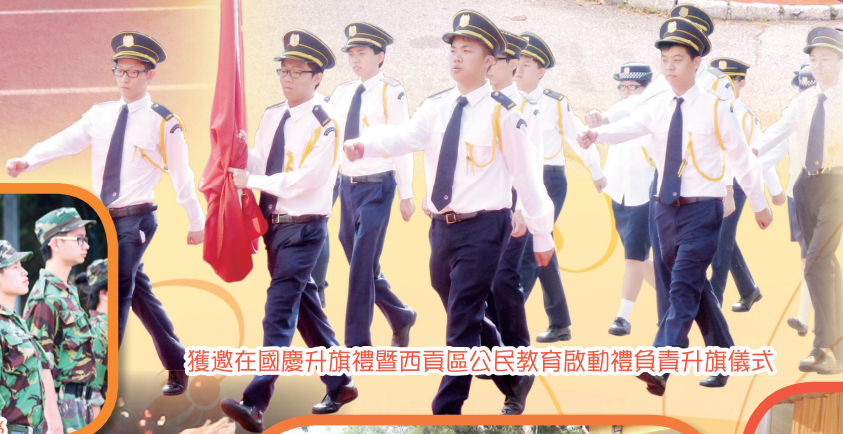
獲邀在國慶升旗禮暨西貢區公民教育啟動禮負責升旗儀式