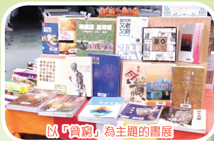
以「貧窮」為主題的書展