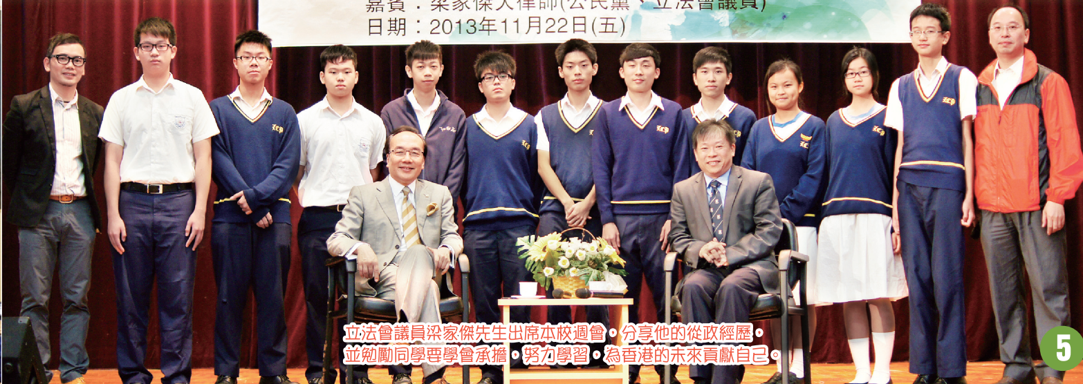
立法會議員梁家傑先生出席本校週會，分享他的從政經歷，並勉勵同學要學會承擔，努力學習，為香港的未來貢獻自己。