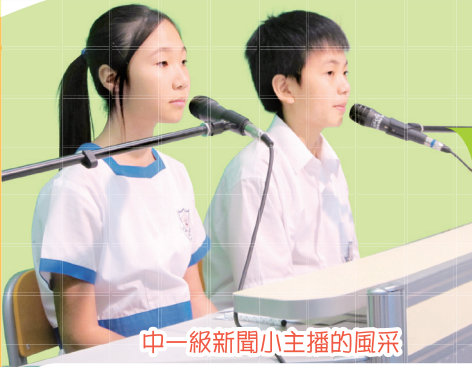
中一級新聞小主播的風采

是次學術週主題為「貧窮」(Poverty)，讓同學了解香港的貧窮現狀，並增進同學對研讀通識教育科的興趣。