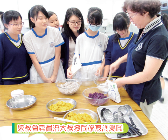
家教會會員潘太教授同學烹調湯圓