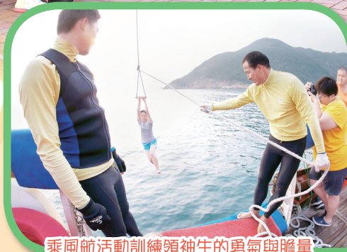
乘風航活動訓練領袖生的勇氣與膽量