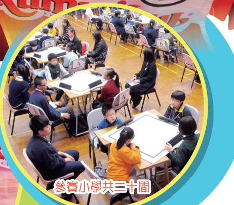
參賽小學共三十間