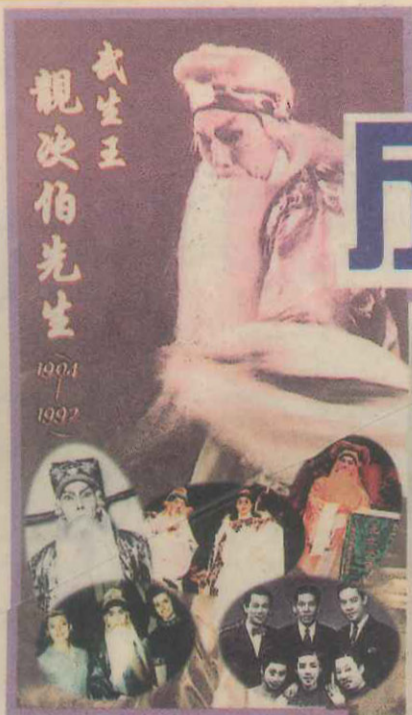
武生王 靚次伯先生 1904 1997